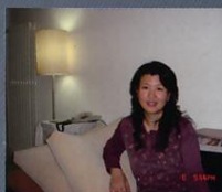
企业方案组别 济南商业银行办公空间装饰方案 李晓红 青岛理工大学艺术学院

方案设计中摒弃灰调的办公空间模式，在空间分隔、材料选择、灯光运用上大胆尝试，另外在一些细节处理上特别注意，如家具陈设、植物景观配置等，使空间层次更加丰富，力求营造一个稳重、融合、略带古典格调氛围、极具人文色彩的现代金融办公空间环境。