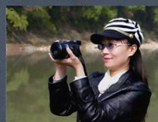
企业方案组别 南河服饰办公空间设计案例 储艳洁 上海商学院 艺术设计学院