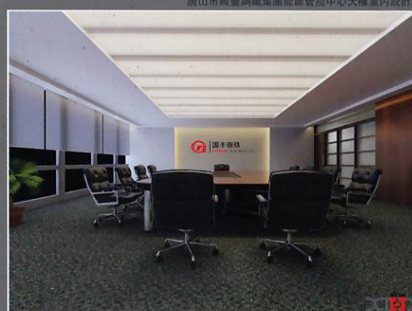
唐山市国丰钢铁集团能源管控中心大楼室内设计图

唐山国丰钢铁有限公司成立于1993年，是一家大型钢铁联合企业，本案设计结合企业文化特征，考虑到企业的价值观、人文观以及企业的精神面貌，在设计中尽量使作品本身与企业特质相融合。由简入繁，融合传统与现代技术手法，运用现代装饰材料，使设计既能体现时代感，又能展现企业风貌。