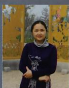
企业方案组别 办公楼室内设计方案 梁燕敏 桂林理工大学艺术学院环境艺术教研室

该方案为某银行办公楼室内设计方案，总体设计以严谨、规矩、大气、简洁的风格来执行设计意图，设计与建筑融合，利用现代设计手法，以竖向的线条的设计元素贯穿始终，以简洁的手法来体现现代银行企业文化体系特色。